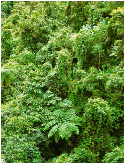
tropický deštný les