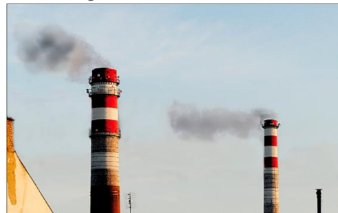
kouřící tovární komíny