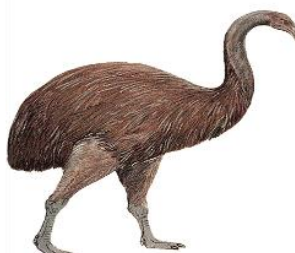
2 Pták moa